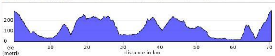
Percorso Corto 70.5 Km - Dislivello 1234 m