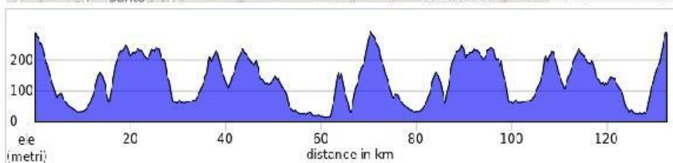
Percorso Lungo 132,6 Km - Dislivello 2322 m